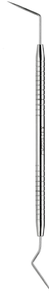
Nº 06 Cód. 467