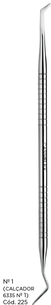
Nº 1 (CALÇADOR 6335 Nº 1) Cód. 225